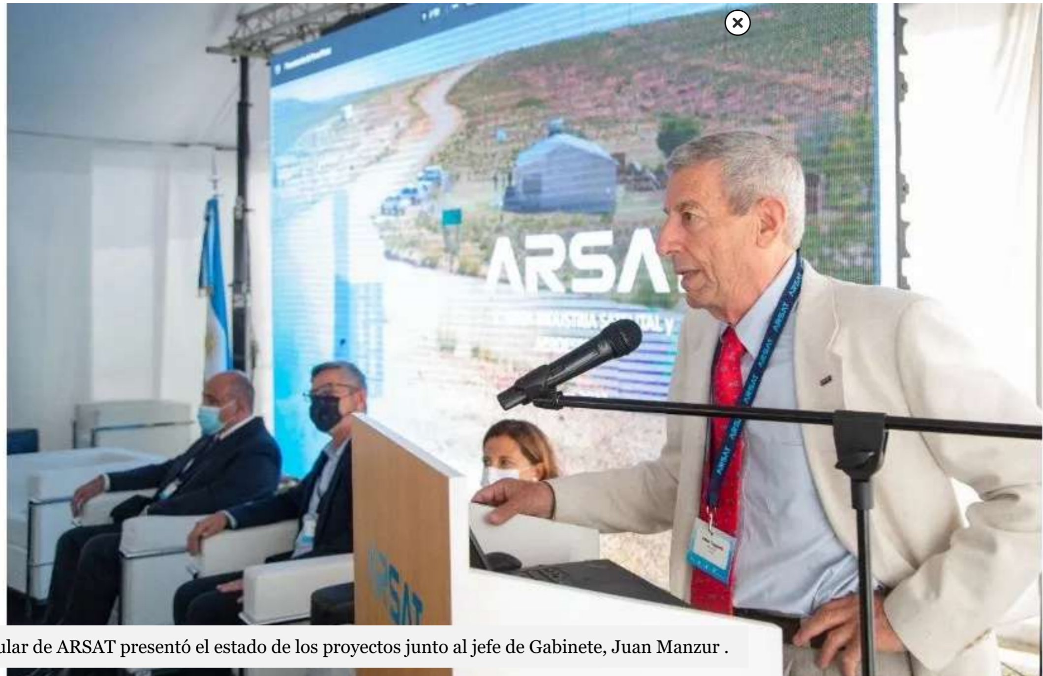
El titular de ARSAT presentó el estado de los proyectos junto al jefe de Gabinete, Juan Manzur.