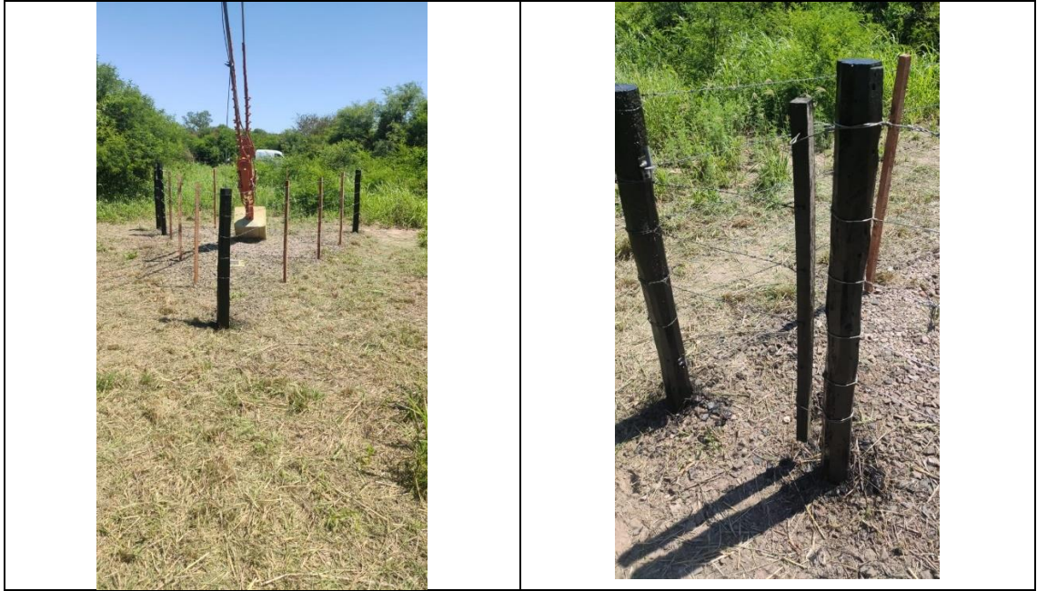
Modelo de Cerco de Anclajes