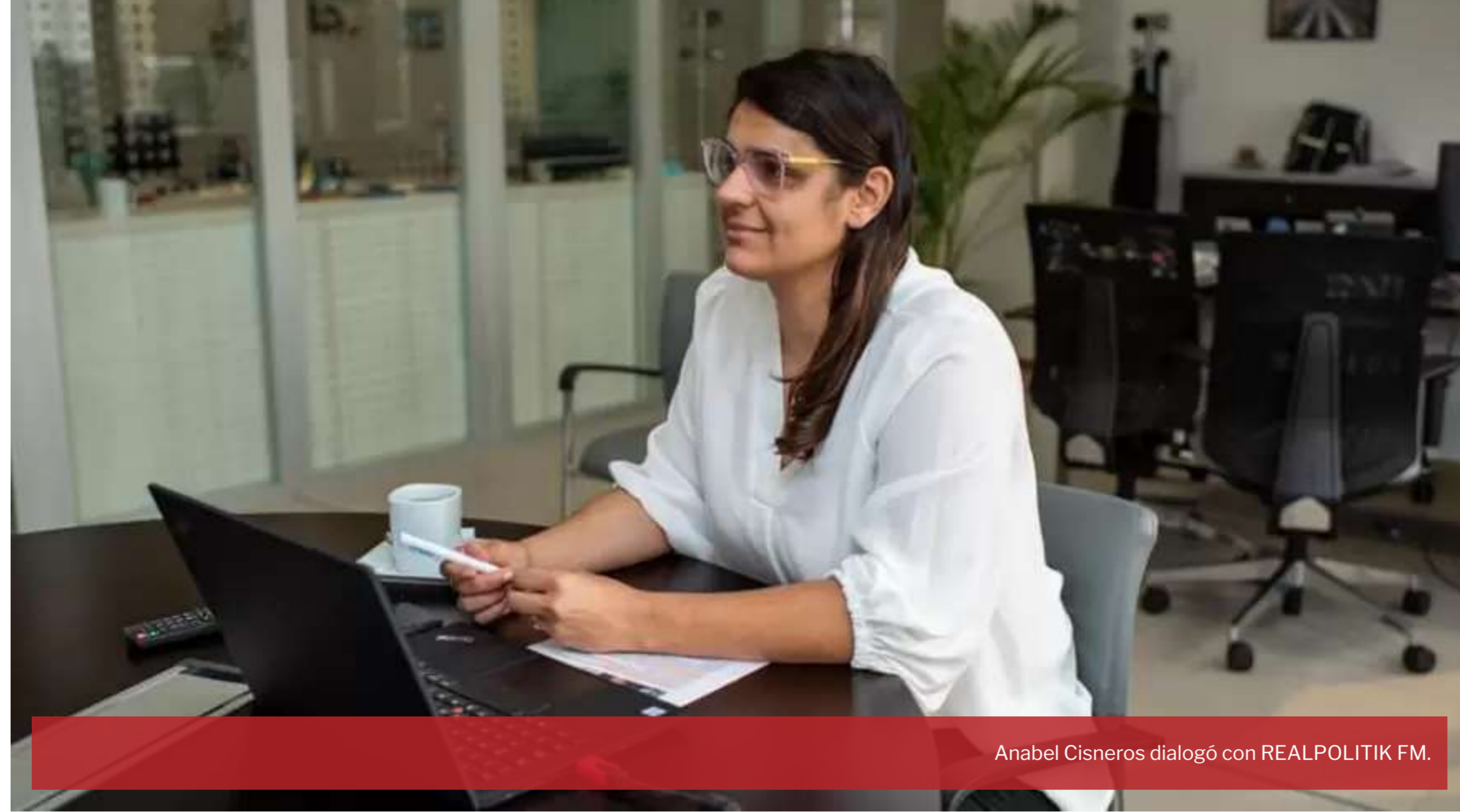
Anabel Cisneros dialogó con REALPOLITIK FM.

La directora nacional de ARSAT, Anabel Cisneros, dialogó con RADIO REALPOLITIK FM (www.realpolitik.fm) sobre el trabajo llevado adelante desde la empresa de telecomunicaciones. Sobre el Cyberwomen Challenge reflexionó: “Nos hace pensar que tenemos mucha materia prima, mucha materia gris, lo cual nos llena de orgullo”.