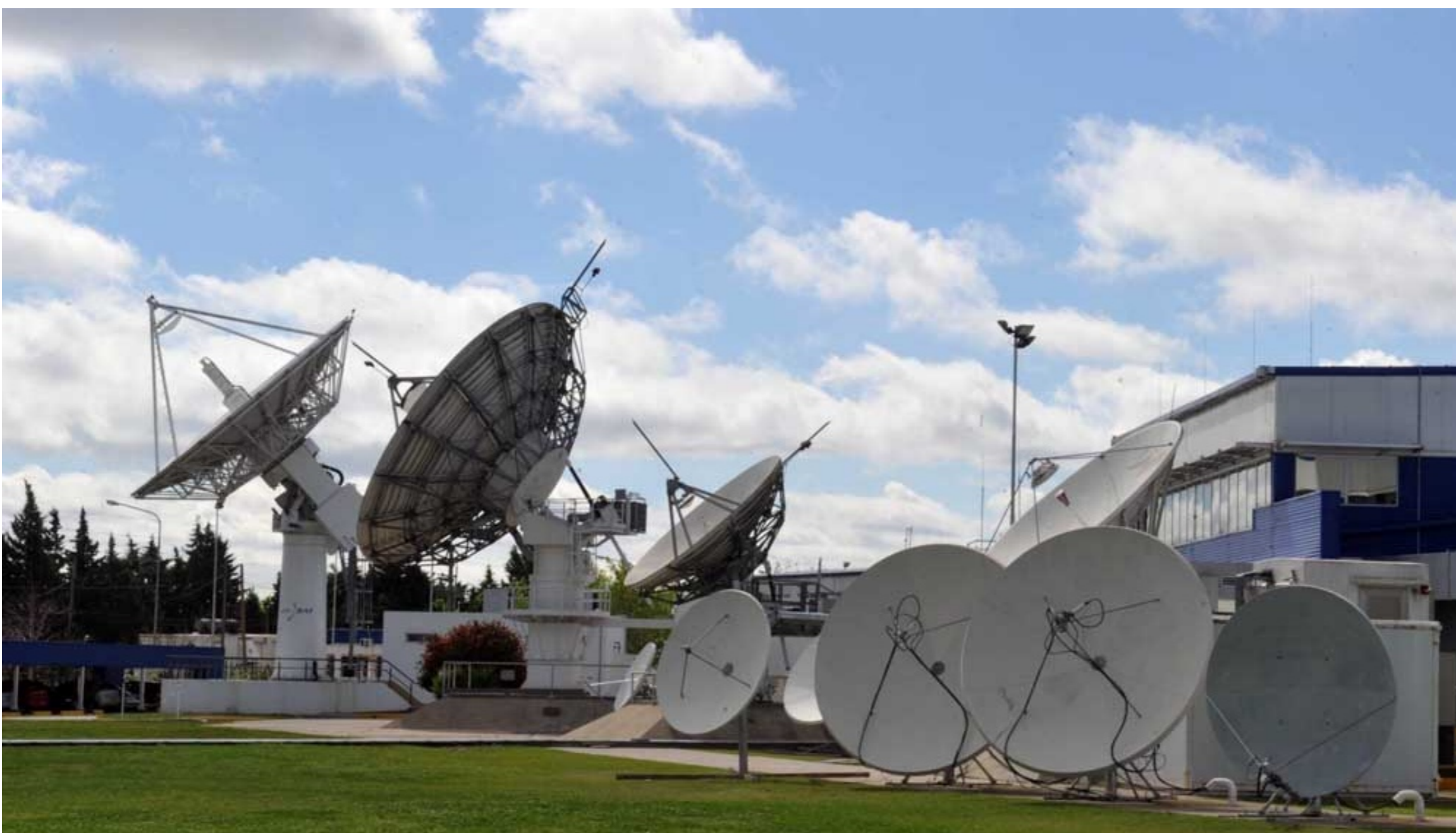
La Refefo es la red administrada por Arsat que lleva internet de fibra óptica a todo el país como proveedor mayorista

La renovación de la red federal de fibra óptica (Refefo) para sostener la conectividad ante el crecimiento de la demanda durante el año pasado requirió de una inversión de $3.300 millones aportados por el Ente Nacional de Comunicaciones (Enacom) a la empresa estatal Arsat.